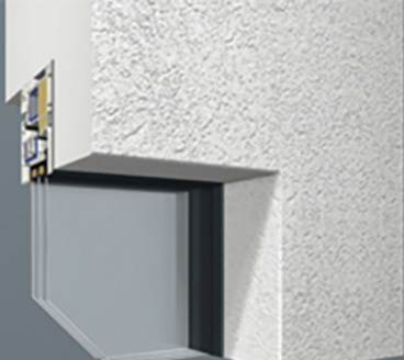
Laibungsvariante mit verdeckt liegenden Fensterrahmen