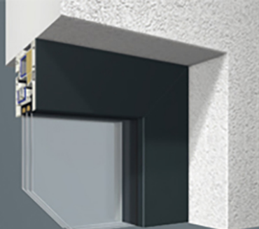
Laibungsvariante mit sichtbaren Fensterrahmen